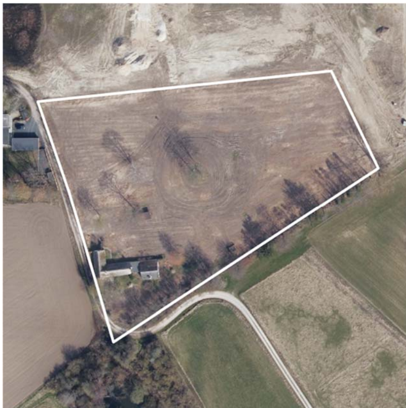
Figur 1. Lokalplanafgræsning og afgrænsning af byudviklingsområde indenfor lokalplanafgrænsningen og som dermed udgør afgrænsningen af nyt kloakopland HEL62S

Byggemodning af Agergårdsvej er omfattet af lokalplan 511.04, som endnu ikke er endeligt vedtaget. Kloakopland HEL62S er afgrænset efter lokalplanens afgræsning.